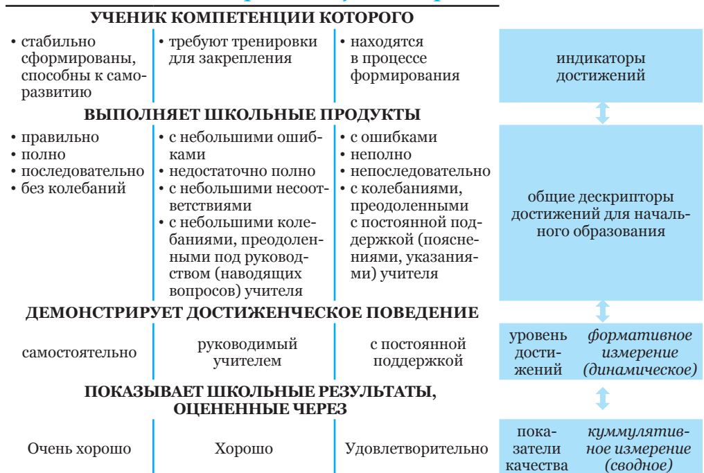
Фигура 1. Оценивание школьных результатов в контексте КОД (согласно Куррикулуму для начального образования)

КОД вписывается в парадигму формирующего оценивания, поэтому в I-IV классах приоритетным является формативное измерение оценки школьных результатов. Таким образом, младшему школьнику обеспечиваются благоприятные условия для успешного достиженческого поведения в комфортном для него ритме и в индивидуальном контексте формирования личности. Желаемые эффекты направлены на поддержание психофизиологического здоровья младших школьников, формирование внутренней мотивации, развитие самооценки на основе формирования способностей к самооцениванию, продвижению межличностного общения в контексте взаимооценивания, поддержке компетенций учения, динамике самообучения и самовоспитания.